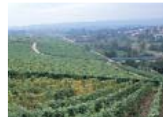
* グレーフェンベルク畑

いまではラインガウNo.1の評価を得ているロバート ヴァイル醸造所の作るアイスヴァイン。ほんの僅かに気泡を残しており、輝きのある若々しい黄金色からまだまだ熟成初期の段階にあることを伺わせる。黄色いリンゴや白い花を思わせるピュアでいきいきとしたアロマが高く、レンゲの蜂蜜のように濃密な甘美さが心地良い。余韻はあくまで長く、とぎれることが無いほど。おかしがたいほどに甘美な純粋さは、白眉である。