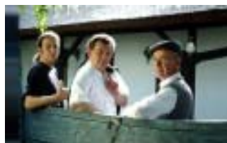
* 親子3代クラッハー ポーイズ

クラッハーでは大樽で熟成させた伝統的なスタイルの(ツヴァイシェン・デン・セーン)と呼ばれるタイプとフレンチ・オークの新樽で熟成される(ヌーヴェル・ヴァーグ)の2つの貴腐ワインを作っている。このワインは美しく輝く琥珀色をしており、マンゴーなどのトロピカル・フルーツや蜂蜜、黒糖などの香りもっているが、葡萄由来の爽やかさを感じる酸もあり、リッチでゴージャスな味わいとなっている。