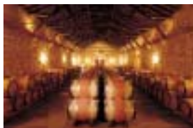
*シャトー ディッサン樽熟庫