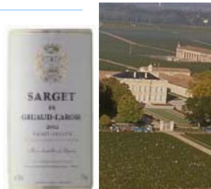
*シャトー グリュオー ラローズ外観

凝縮感の高い黒いベリー系果実のアロマが高く、各種のスパイス、コーヒー、カカオ、ヴァニラなどの複雑な風味を持つ。フレッシュで活力にあふれたミディアム・フルのリッチなワイン。