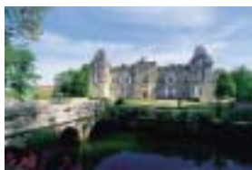
*シャトー ディッサン外観