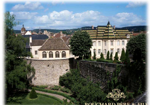
BOUCHARD PÈRE & FILS