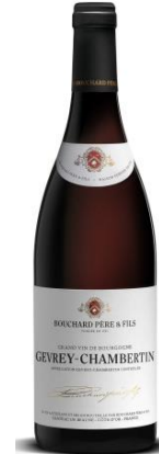
BLGC16 ジュヴレ シャンベルタン 2016

涼しい印象からスワリングをすることで赤い果実の香りが出てくる。繊細なタンニン、酸味と果実味のバランスが取れているが、少々酸味がまさりアルコールのボリュームを感じられる。