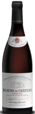
BLBR16 ボーヌ デュ シャトー プルミエ クリュ赤 (ドメーヌ) 2016

赤い果物のニュアンス。酸味は程々、モカ的なフレーバーがあり、後味に舌にしっかりと収斂するタンニン分が感じられる。重心が低くしっかりしたワイン。