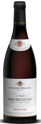
BLVP16 ピノ ノワール ラ ヴィニエ 2016

2015年と比較すると硬く「 熟成のポテンシャルのある年 」の印象がある一方、もう既に口の中で果物を実感できる「 果実の年 」とも言え、 バランスの優れたヴィンテージ です。今飲んでもブルゴーニュの真骨頂が理解できるくらい、優しくていきいきした 早飲みできるワイン です。